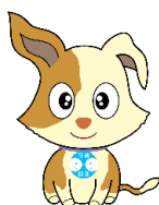
行政相談マスコットキャラクター キクーン

【特徴】実際に生徒から行政相談を受け、必要に応じて、行政機関等の協力を得ながら改善を促すなど、実践を伴った出前授業です。