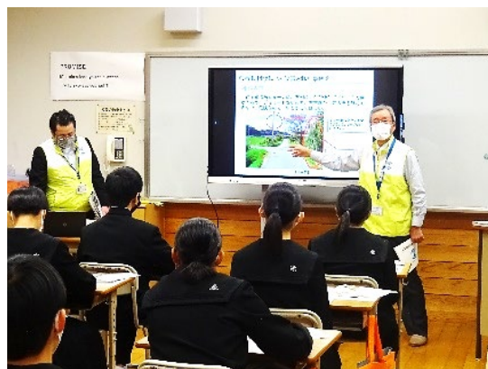
《令和 4 年度の行政相談出前教室（今治市立朝倉中学校）開催風景》